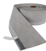
Taśma progowa PL3 z paskiem butylu