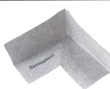
Narożnik wewnętrzny PL3